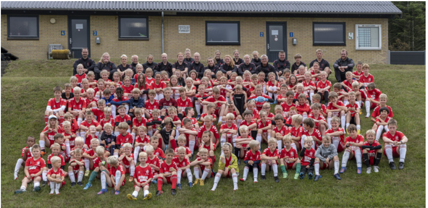
Hele fodboldskolen, trænere, medhjælpere og elever, samlet. Der er flere billeder, heriblandt billeder af hvert hold, på www.norsbk.dk

Nors Boldklub afviklede i uge 26 DBU Fodboldskole for 31. år i træk. Vi har over de seneste år oplevet en øget interesse for at deltage på fodboldskolen, og derfor havde vi i år åbnet op for plads til yderligere 33 deltagere, hvilket betød at i alt 129 børn i alderen 6-14 år deltog i år. Mange af deltagerne spiller til dagligt i Nors/Hillerslev, men vi havde også deltagere fra andre fodboldklubber i Thy, og sågar fire "feriebørn" fra København. På trods af forskellige klubforhold og forskelligt geografiske udgangspunkter forløb ugen godt og nye venskaber opstod hurtigt på tværs af alder og tilhørsforhold.